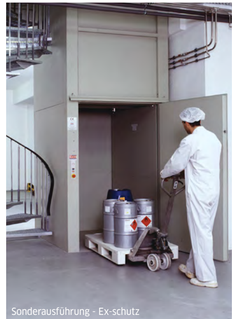
Sonderausführung - Ex-schutz