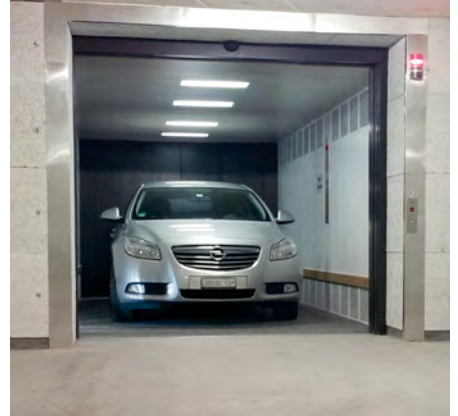
Wildbachstrasse - Zürich, Schweiz