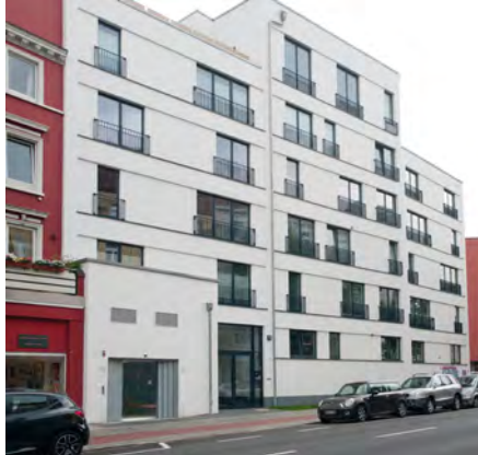
Müggenkampstrasse - Hamburg, Deutschland