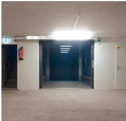
Dorfstrasse, Winterthur - Zürich, Schweiz