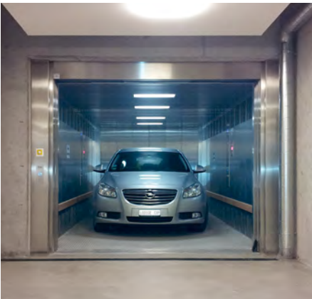
Tiefgarage - Zürich, Schweiz