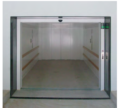
Bollerweg - Wädenswil, Schweiz