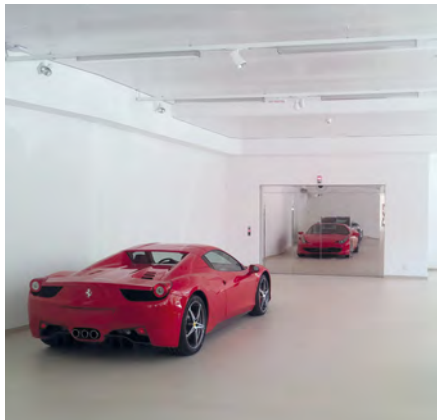
Garage Zenith SA - Sion, Schweiz