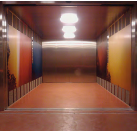
Münchhaldeneck - Zürich, Schweiz