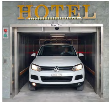
Garage Swissotel - Zürich, Schweiz